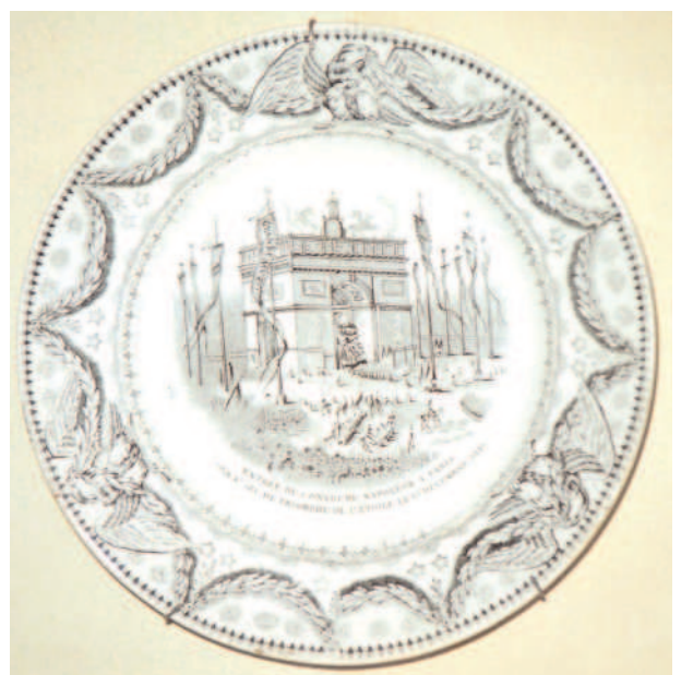
Fig. 4 - Assiette ayant le N° 6 placé à gauche, imp. grise. D = 21 cm

Celles à la marque E6 ont été produites entre 1841 et 1843. Celles à la marque E8 sont postérieures à 1844. Toutes ont été réalisées par la société Lebeuf, Milliet et Cie.