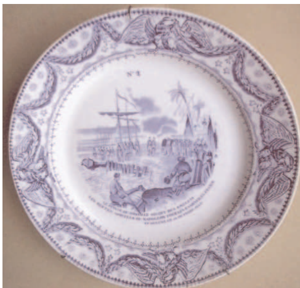
Fig. 5 - Assiette ayant le N° 2 placé en haut, imp. bleue, 4 aigles. D = 23,1 cm Photo J.-C. Linol

12 - LE ROI LOUIS PHILIPPE REMET AU GÉNÉRAL BERTRAND L'ÉPÉE DE / NAPOLÉON POUR LA DÉPOSER SUR LE CATAFALQUE / DANS L'ÉGLISE DES INVALIDES (***)