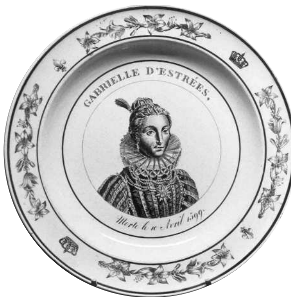
Fig. 2 - GABRIELLE D'ESTRÉES, / Morte le 10 Avril 1599. Sans marque.