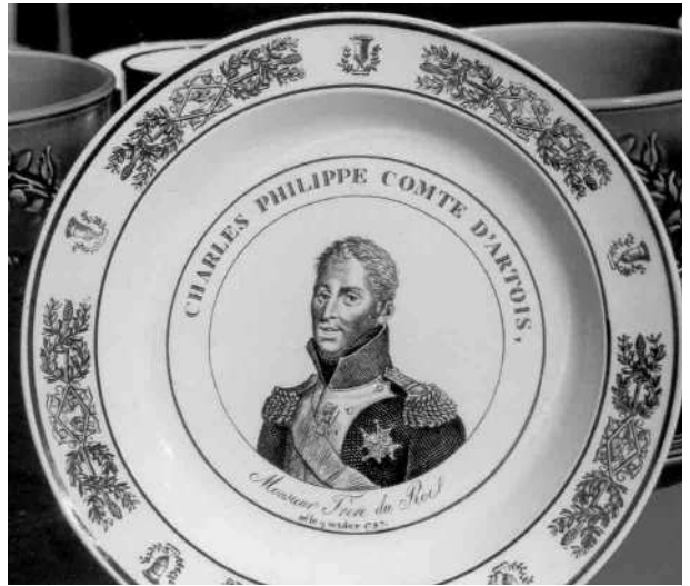
Fig. 9 - CHARLES PHILIPPE COMTE D'ARTOIS, / Monsieur Frère du Roi / né le 9 octobre 1757.

Le comte d'Artois était connu dans sa jeunesse pour son libertinage, son amour du jeu, et ses folles dépenses : ne paria-t-il pas avec Marie-Antoinette, sa belle-sœur, qu'il parviendrait à faire construire en 60 jours une "folie" ? Il gagna son pari, et ainsi naquit le château de Bagatelle. En 1789, il fut un des premiers à quitter la France. A son retour d'exil en 1814, il avait gardé ses convictions absolutistes, et il prit la tête du mouvement ultra, inconscient de l'opposition qui réunissait les anciens révolutionnaires, les bonapartistes, les royalistes modérés et