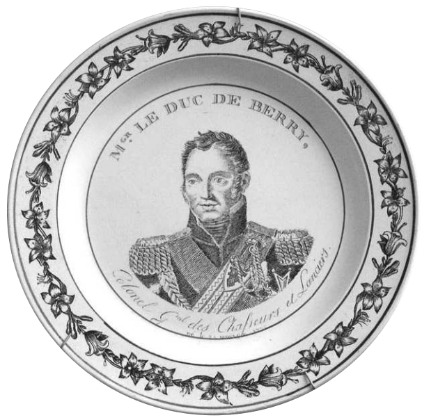
Fig. 12 - Mgr LE DUC DE BERRY, / Colonel Général des Chasseurs et Lanciers. / né le 24 janvier 1778.