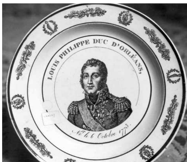
Fig. 15 - LOUIS PHILIPPE DUC D'ORLÉANS, / Né le 6 Octobre 1773.