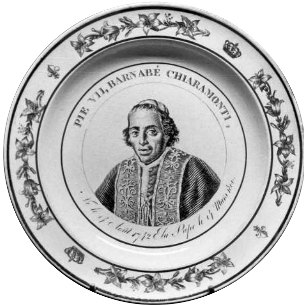
Fig. 17 - PIE VII, BARNABÉ CHIARAMONTI, / Né le 14 Août 1742 Elu Pape le 14 Mars 1800.