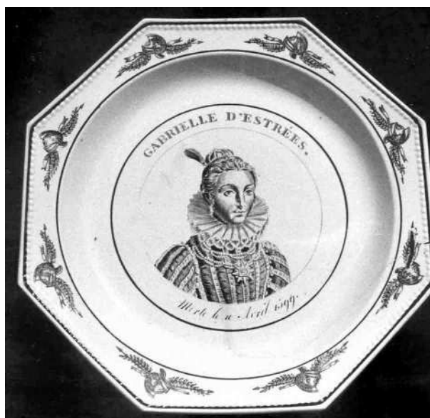
Fig. 2bis - GABRIELLE D'ESTRÉES, / Morte le 10 Avril 1599. Marque en creux Mau N°7, de type A1.

Il n'y avait pas meilleure publicité pour les Bourbons de la Restauration que ce Roi encore aimé du Peuple trois siècles après sa mort. Car, je le répète, les personnages qui sont représentés sur ces assiettes étaient connus de ceux qui les utilisaient chaque jour...ou même tous les dimanches ! Le fait que le Béarnais ait abjuré sa religion au profit du catholicisme ne pouvait que plaire aux princes de la Restauration, fervents serviteurs de la Foi et du Pape.