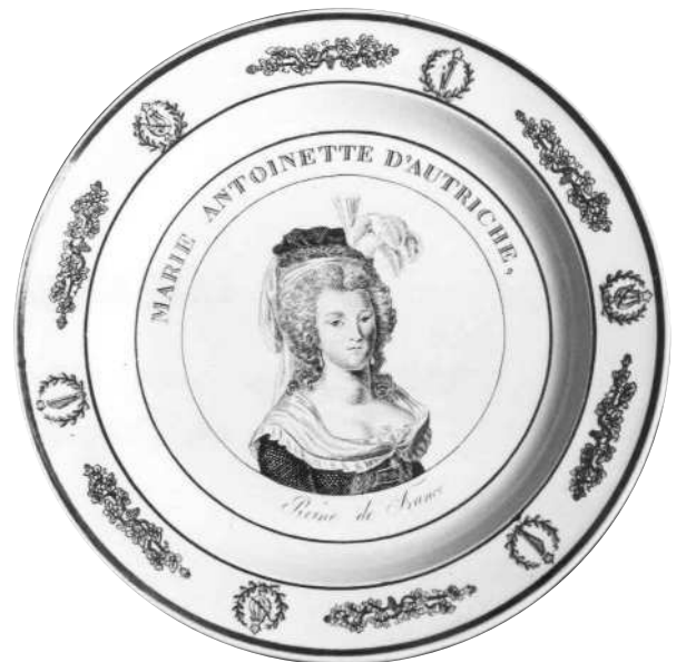
Fig.7 bis - MARIE ANTOINETTE D'AUTRICHE, / Reine de France. Marque imprimée, sur 4 lignes, de Méry & Cie à Paris.