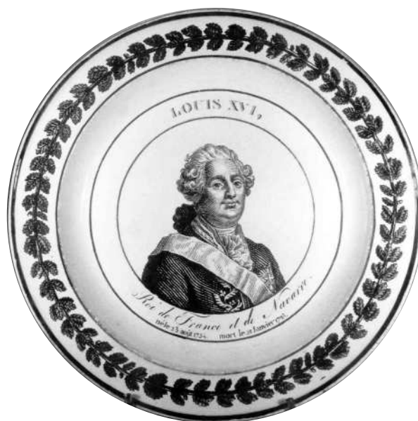
Fig.6 bis - LOUIS XVI, / Roi de France et de Navarre. / né le 23 août 1754. mort le 21 janvier 1793.

Marque en creux CHOISY + marque imprimée, sur 4 lignes, de Méry & Cie (idem fig. 9 quater de PF 39, p. 6).