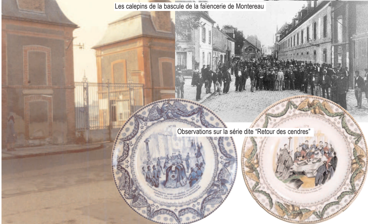
Observations sur la série dite "Retour des cendres"