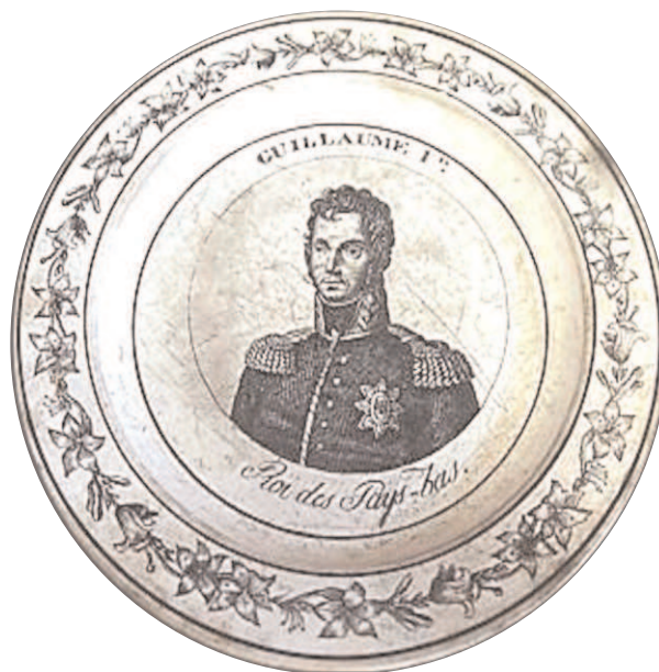
Fig. 21 - GUILLAUME Ier / Roi des Pays-bas.

Son nom est Frédéric d'Orange-Nassau, et il était affilié à la Prusse par sa mère, Wilhelmine de Prusse. En 1791, il épousa une autre Wilhelmine de Prusse. Son royaume fut une création du Congrès de Vienne (oct. ou nov. 1814 à juin 1815). Les quatre grandes puissances qui s'étaient coalisées contre Napoléon (Angleterre, Autriche, Prusse, Russie) avaient décidé de retracer l'Europe en annexant les territoires qui leur convenaient le mieux, et en ramenant la France à ses limites de 1792 (11bis). Un nouvel état fut donc créé en adjoignant la Belgique (qui était alors française) aux Pays-Bas autrichiens. Les habitants n'avaient bien sûr pas été consultés ! La France se retrouvait entourée d'états tampons, favorables aux anciens Coalisés, qui devaient empêcher une expansion de son territoire au cas où