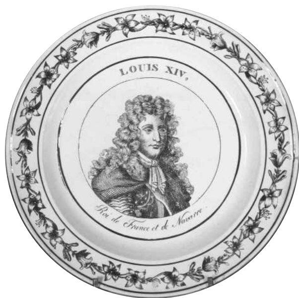
Fig.3 - LOUIS XIV, / Roi de France et de Navarre. Marque MONTEREAU en creux, de type A2bis. Musée de Brunoy, inv. R.950.245.0.