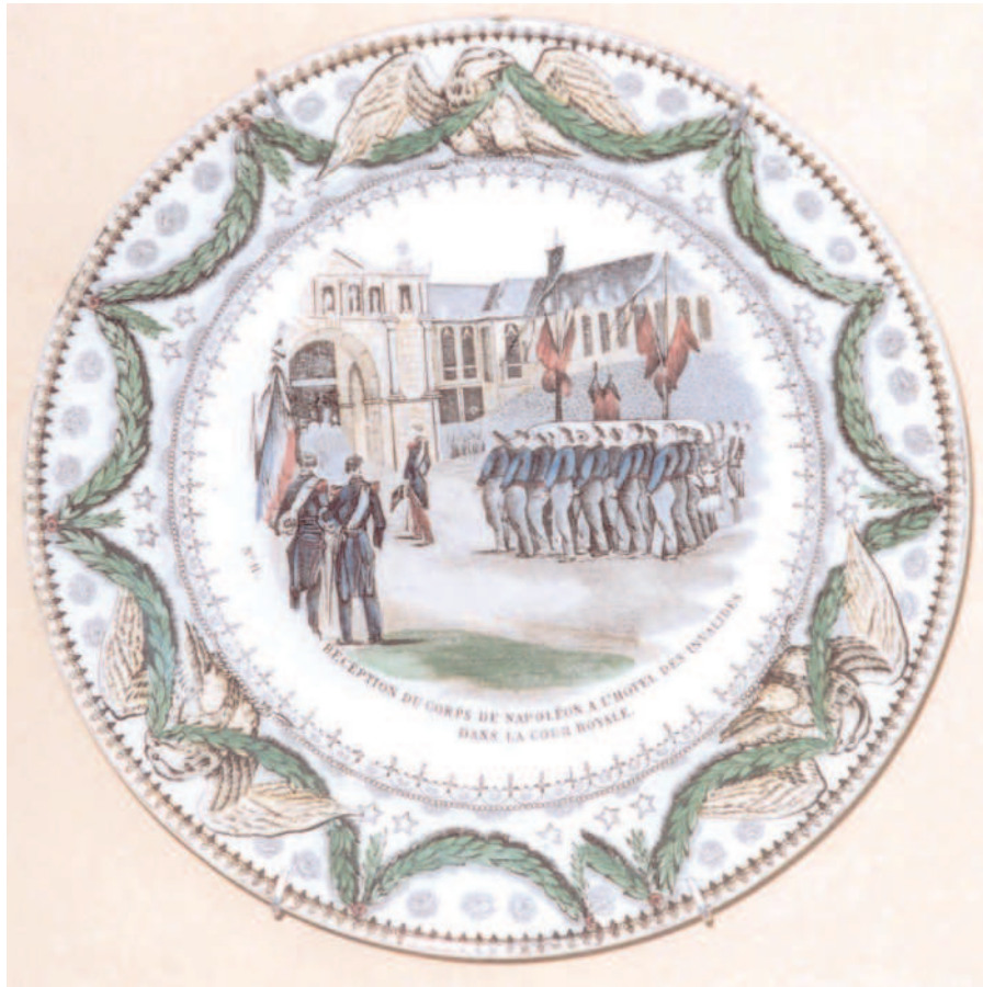
Fig. 3 - Assiette ayant le N° 11 placé à gauche, polychrome. D = 20,5 cm

Diamètre 21 cm en gris et fond blanc ou en polychrome, plus fine, marque E8, CREIL, et 3 C / 5 en creux (ou partiel). La vignette est numérotée à gauche (Fig. 4).