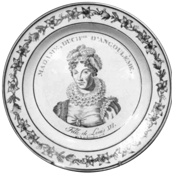
Fig. 11 - MADAME, DUCHESSE D'ANGOULEME, / Fille de Louis XVI, / née le 10 (ou 19) décembre 1778.

Marque MONTEREAU en creux, de type A2 ter.