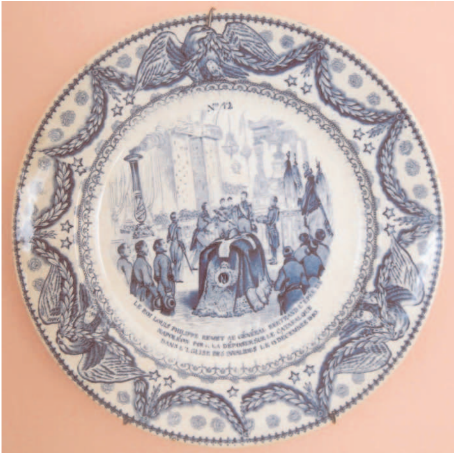
Fig. 1 - Assiette ayant le N° 12 placé en haut, imp. bleue, marque CREIL en creux. D = 20,8 cm

Cette série n'est pas titrée mais le thème en est bien déterminé. Les événements se déroulent du 16 octobre au 15 décembre 1840.