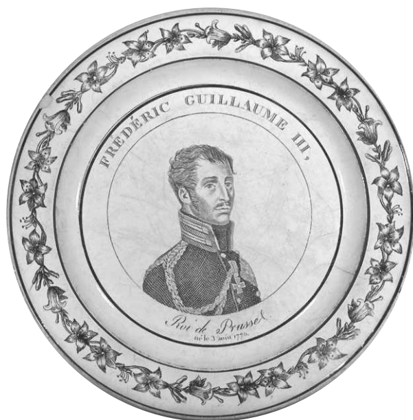
Fig. 19 - FRÉDÉRIC GUILLAUME III, / Roi de Prusse / né le 3 août 1770.

Marque MONTEREAU en creux de type A2 bis. Musée de Montereau, inv. MRO.90.13.01.