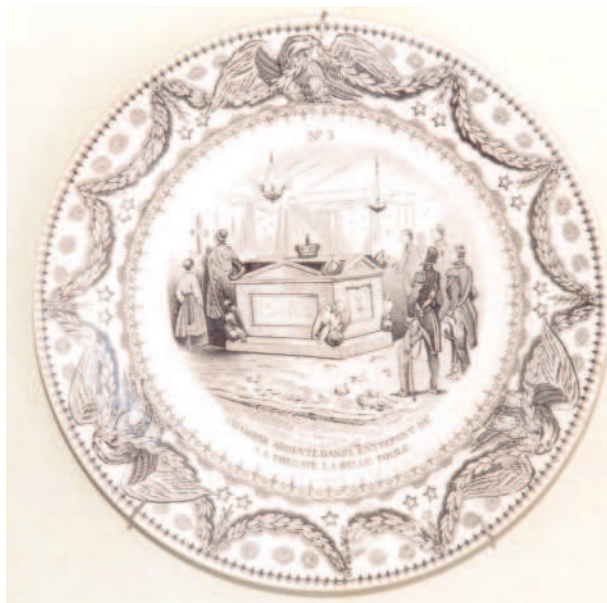
Fig. 2 - Assiette ayant le N° 3 placé en haut, imp. grise, marque CREIL en creux, D = 21 cm

Diamètre 20,5 cm en polychrome, marque E6, CREIL et 8 C / 5 en creux (ou partiel selon les assiettes). La vignette est numérotée à gauche et la date ne figure pas toujours sur cette version (Fig. 3).