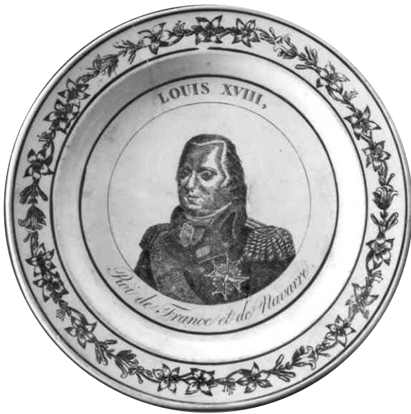
Fig.8 - LOUIS XVIII, Roi de France et de Navarre Marque MONTEREAU en creux, de type A2bis. Photo F. Noël, 1985-02

maintenant manifeste. Elle le poussa à fuir avec l'aide d'Axel de Fersen, un suédois follement amoureux d'elle (réciproquement ? hé ?), fit appel aux armées étrangères pour sauver son trône, manifesta une profonde indifférence devant la misère du peuple. Elle fut haïe.