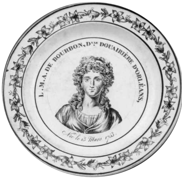
Fig. 14 - L.M.A. DE BOURBON, Dsse DOUAIRIÈRE D'ORLÉANS, / Née le 13 Mars 1753.

Marque MONTEREAU en creux, de type A2 bis.