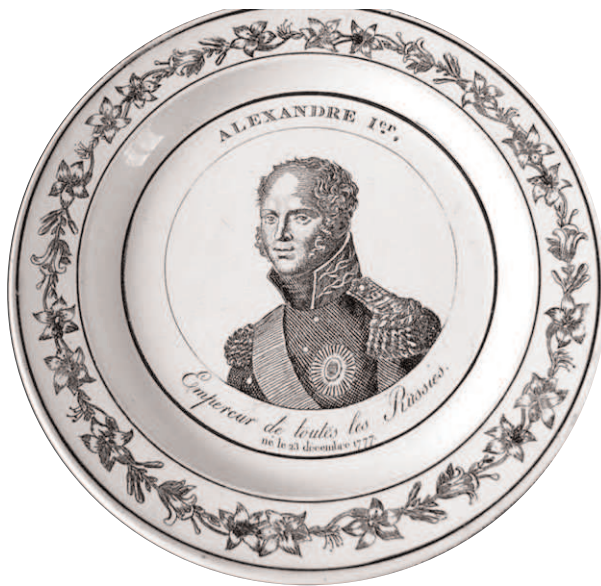
Fig. 22 - ALEXANDRE Ier / Empereur de toutes les Russies. / né le 23 décembre 1777

Marque MONTEREAU en creux, de type A2 bis.