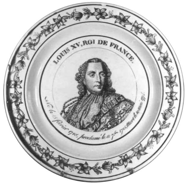
Fig.5 - LOUIS XV, ROI DE FRANCE. / Né le 15 février 1710, proclamé le 12 7bre 1715, Mort le 10 mai 1774.

On s'intéressait aux nouveautés, et on essayait de gagner beaucoup d'argent. C'est pourquoi la tentative de Law, remplacer la monnaie sonnante et trébuchante par une monnaie en papier, eut tant de succès. Même si elle se termina par une déroute financière, l'expérience avait donné un coup de