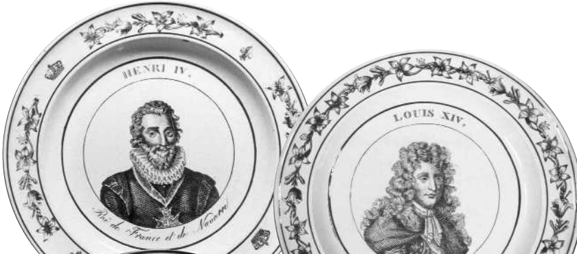
Généalogie des Bourbons et leurs portraits dans des assiettes de Montereau et Choisy