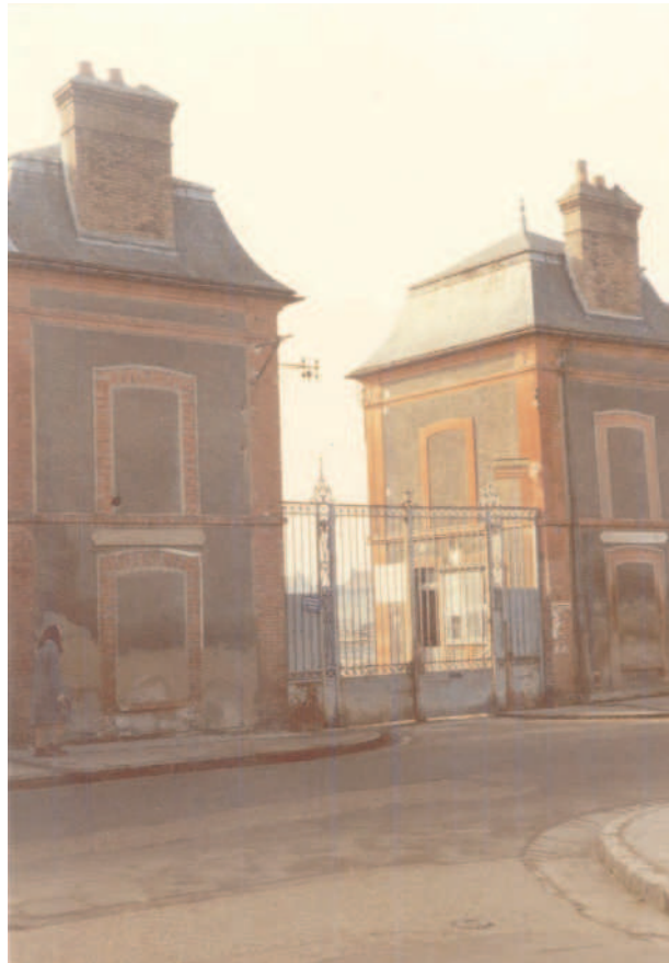
Fig. 1 - L'entrée de la faïencerie, avec son pont-basculé et la loge du concierge.

Chéreau, briquots : 88.270 Kg Salins, terre réfractaire : 89.380 Kg Salins, faïence : 15.440 Kg Salins, ivoire : 21.500 Kg Salins, terre à colifichets : 22.810 Kg colifichets : 10.270 Kg débris de moules : 45.800 Kg fouilles, immondices : 101 Tbx gaz, immondices : 18 Tbx Nodet, colifichets : 42 Tbx Nodet, immondices : 110 Tbx Nodet, mâchefer : 7.521 Kg Besson, immondices : 144 Tbx Besson, débris de moules : 28.501 Kg