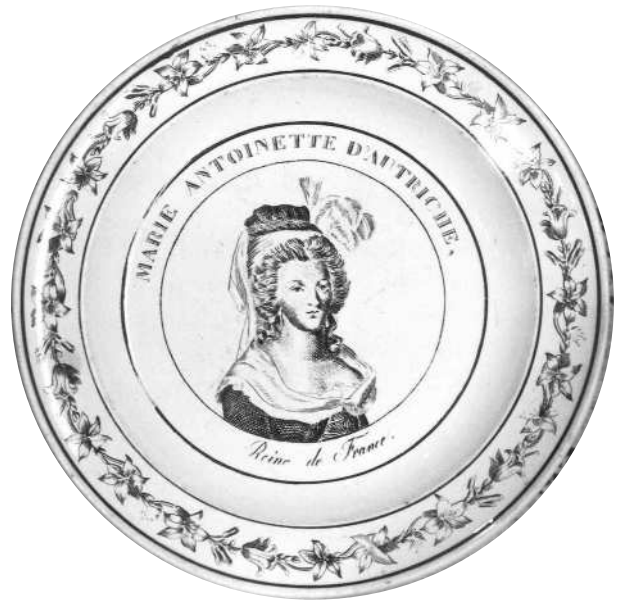
Fig.7 - MARIE ANTOINETTE D'AUTRICHE, / Reine de France. Marque en creux Mau N°11, de type A1.

Après neuf ans de mariage et une opération du Roi, la Reine mit au monde en 1778, Marie-Thérèse-Charlotte, dite Mme Royale. Puis en 1781, Louis-Joseph, qui mourut en 1789. Puis en 1785,