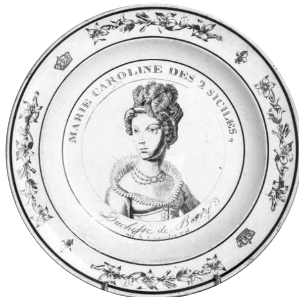
Fig. 13 bis - MARIE CAROLINE DES 2 SICILES, / Duchesse de Berry / née le 5 novembre 1798.

Après la mort de son époux, la Duchesse alla s'installer aux Tuileries, où ses rapports avec la duchesse d'Angoulême ne furent pas toujours aisés. Marie-Caroline fuyait l'étiquette, et préférait lancer la mode des bains de mers à Dieppe ou à Boulogne-sur-mer.