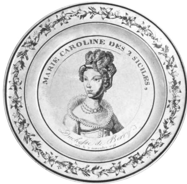
Fig. 13 - MARIE CAROLINE DES 2 SICILES, / Duchesse de Berry / née le 5 novembre 1798.