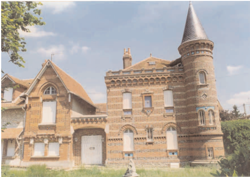
Fig. 2 - Vue partielle de la maison BOULENGER, à Cessoy (S&M).