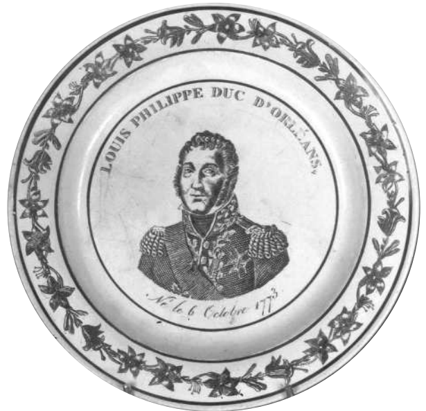
Fig. 15 - LOUIS PHILIPPE DUC D'ORLÉANS, / Né le 6 Octobre 1773.