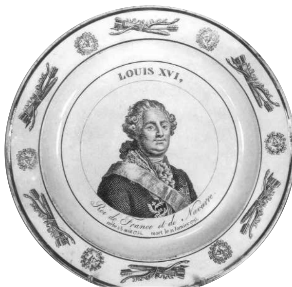
Fig.6 - LOUIS XVI, / Roi de France et de Navarre. / né le 23 août 1754. mort le 21 janvier 1793.

Cela explique pourquoi, lors de la tourmente, poussé par Marie-Antoinette, il crut légitime de faire appel en secret à l'aide de l'Autriche. Le manifeste de Brunswick (nom du général en chef autrichien qui signa cette déclaration rédigée par un