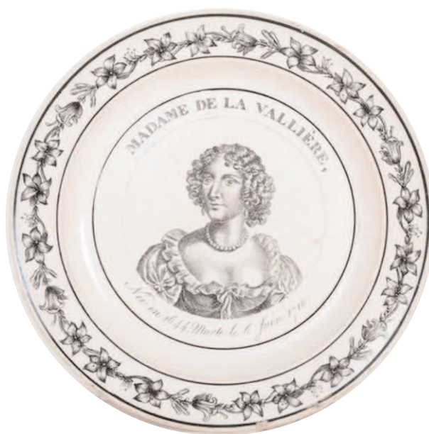
Fig.4 - MADAME DE LA VALLIÈRE, / Née en 1644, Morte le 6 juin 1710. Marque MONTEREAU en creux, de type A2bis.