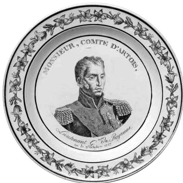
Fig. 9 bis - MONSIEUR, COMTE D'ARTOIS, / Lieutenant Général du royaume / né le 9 octobre 1757

Marque MONTEREAU en creux, de type A2bis. Photo G. Grandpierre, 2006-07