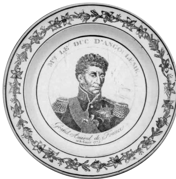
Fig. 10 - Mgr LE DUC D'ANGOULEME, / Grand Amiral de France / né le 6 août 1774.

Marque MONTEREAU en creux, de type A2bis. Photo G. Grandpierre, 2006-07