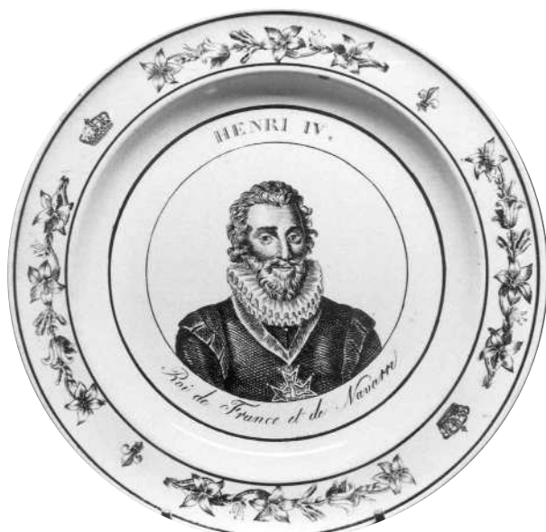
Fig. 1 - HENRI IV, / Roi de France et de Navarre. Marque MONTEREAU en creux, de type A 4.