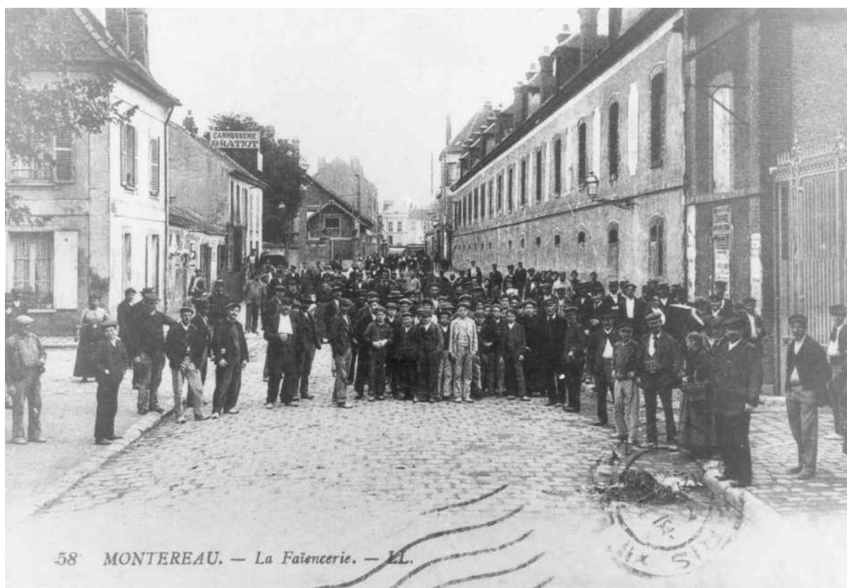
Fig. 3 - Les ouvriers s'apprêtent à entrer dans la faïencerie, mais les grilles sont encore fermées