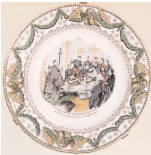
Fig. 6 - Assiette ayant le N° 1 placé en haut, polychrome, 4 aigles. D = 23,4 cm