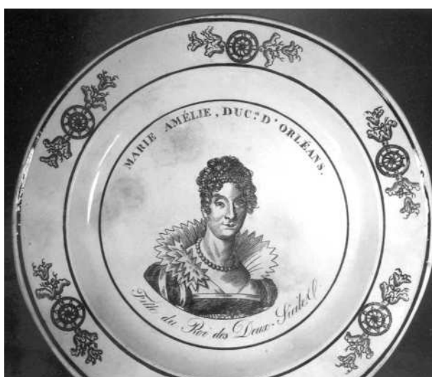
Fig. 16 - MARIE AMÉLIE, DUCse D'ORLÉANS. / Fille du Roi des Deux-Siciles