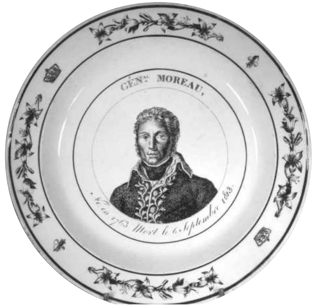
Fig. 18 - GÉN al MOREAU, / Né en 1763 Mort le 6 Septembre 1813.