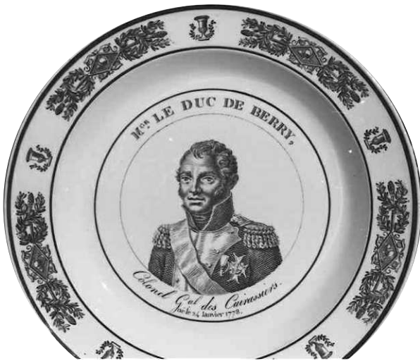
Fig. 12 bis - Mgr LE DUC DE BERRY, / Colonel Gal des Cuirassiers. / né le 24 janvier 1778.